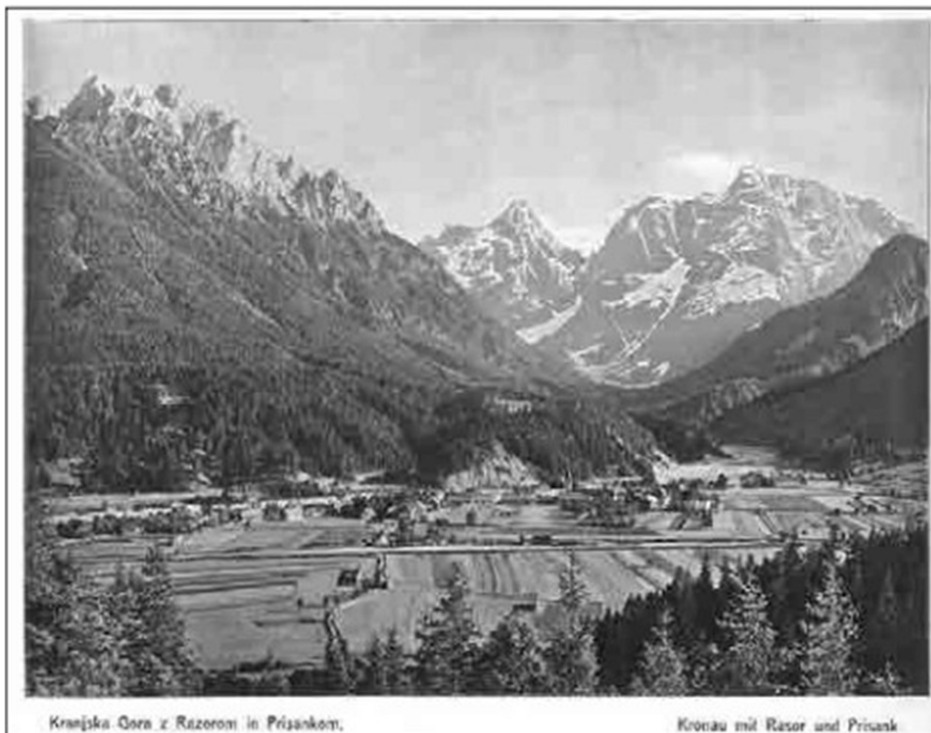
Slika 3: Kranjska Gora včasih

Danes Zgornjesavska dolina združuje naravno in kulturno dediščino z modernim turizmom. Obiskovalce privlačijo alpske vasi, gorski vrhovi, slapovi, muzeji in tradicionalne prireditve kot so Pokal Vitranc ter ostali športni in kulturni dogodki (Kranjska Gora, 2024).