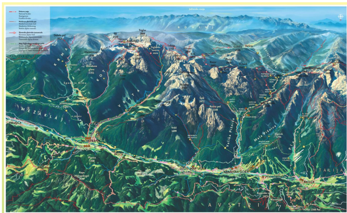
Slika 1: zemljevid območje Zgornjesavske doline

Zgornjesavska dolina je zaradi svoje lege zelo enostavno dostopna, saj leži blizu pomembnih prometnic.