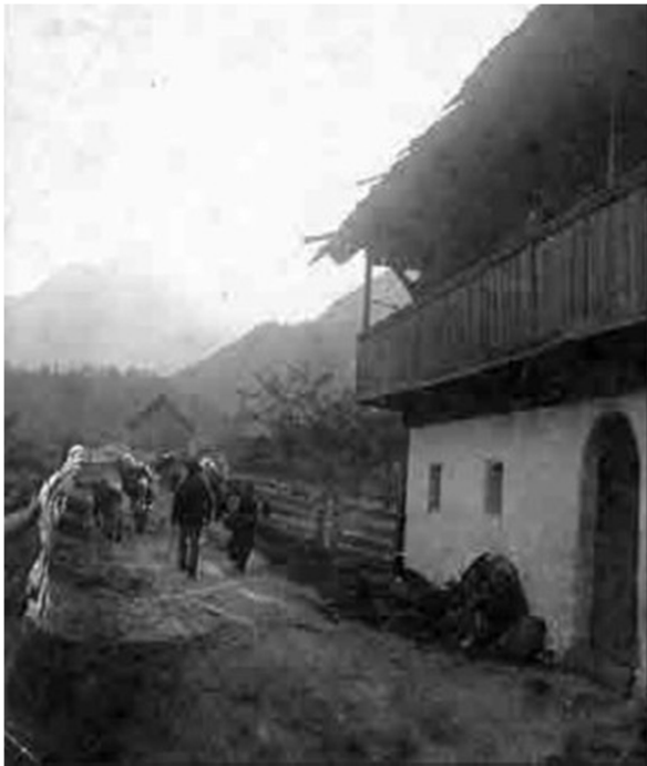
Slika 5: Gnanje krav na pašo