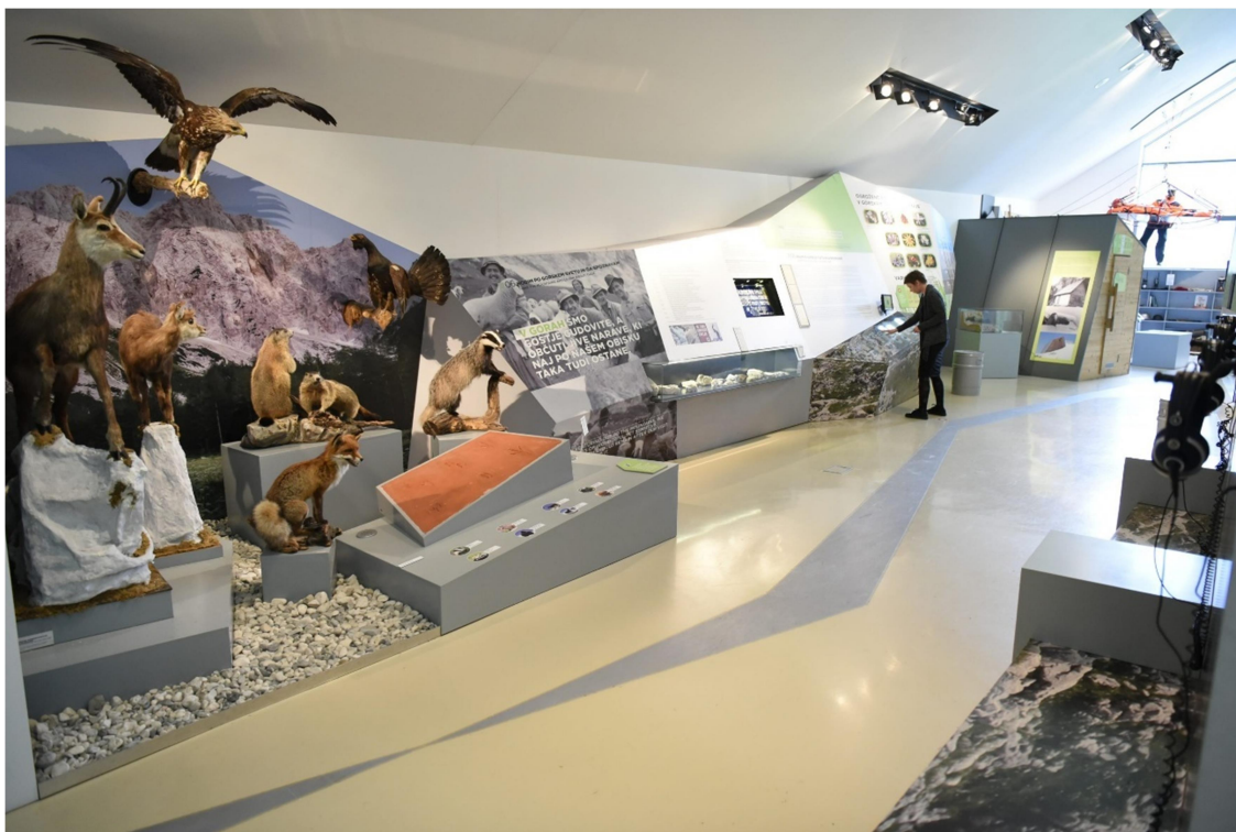
Slika 9: stalna razstava v Slovenskem planinskem muzeju, vir: https://www.planinskimuzej.si/stalna-razstava/