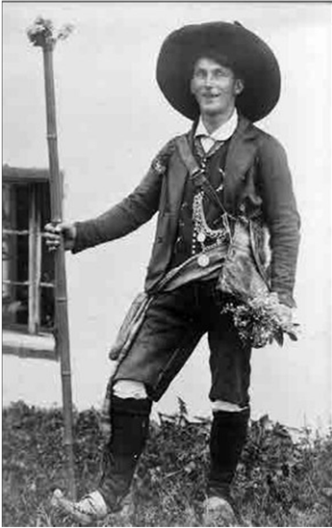
Slika 4: Pastir iz Rateč, vir: Kačičnik Gabrič, 2016.