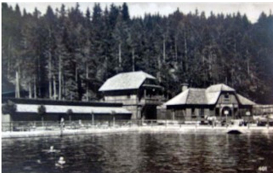
Slika 2: kopališče ob jezeru Jasna pred drugo svetovno vojno

V 19. stoletju se je dolina začela razvijati kot turistična destinacija. Prvi obiskovalci so bili predvsem pohodniki, alpinisti in naravoslovci iz Avstro-Ogrske, ki so raziskovali vrhove Julijskih Alp. Leta 1906 je bila odprta železniška povezava med Jesenicami in Beljakom, kar je še dodatno spodbudilo obisk doline. Kranjska Gora je postajala vse pomembnejše središče za zimski in poletni turizem (Kranjska Gora, 2024).