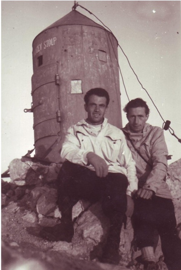
Slika 7: vzpon na Triglav, vir: https://www.visitmojstrana.si/sl/o-nas/zgodovina

Takrat so obnovili številne kočice in poti, modernizirali dostop ter zgradili nove planinske objekte. Zgornjesavska dolina se je vse bolj uveljavljala kot eno glavnih izhodišč za vzpone v osrčje Triglavskega narodnega parka. Obiskovalci iz vse Jugoslavije so se z avtobusi in vlaki odpravljali na ture – od enodnevnih pohodov po dolini Tamar do večdnevnih tur v Julijce (Kačičnik, 2016).