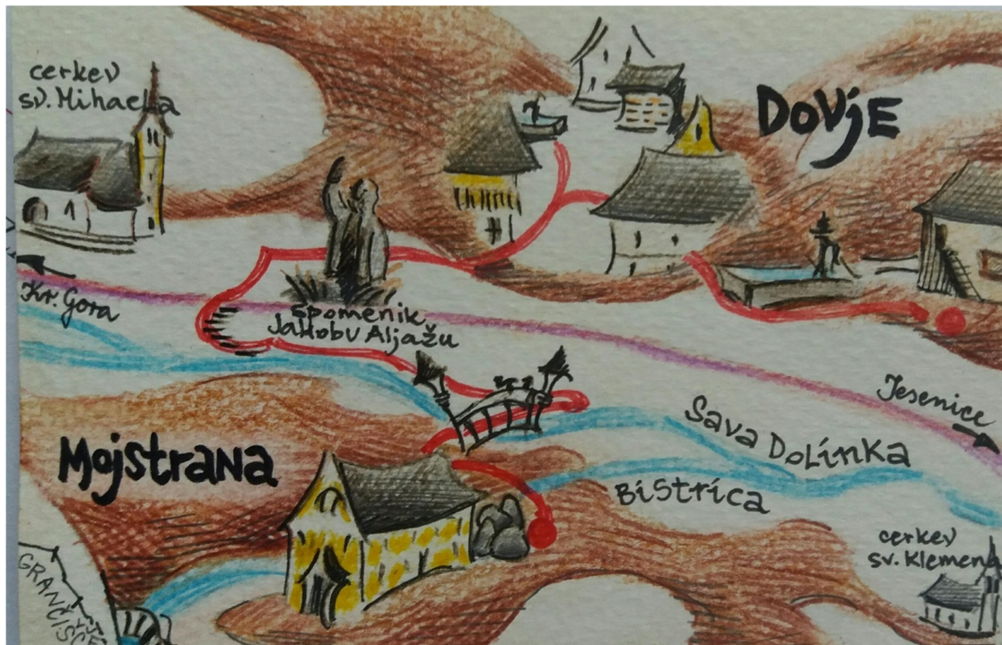
Slika 8: zemljevid poti po kateri se bomo sprehodili

Sledi vzpon proti vasi Dovje, kjer bo naša prva postojanka pri cerkvi sv. Mihaela, tam bomo prisluhnili zgodbi kako je nastala cerkev. Nato se bomo odpravili prti vaškemu jedru in naprej proti karavli, kjer bomo na koncu lahko uživali v prečudovitem razgledu. Med potjo se bomo pogosto ustavili in prisluhnili še ostalim pravljicam. ( Zavod za turizem Kranjska Gora )